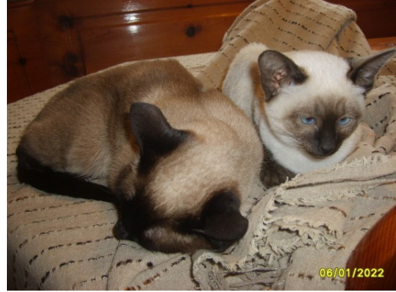
Şeşbeş ve Pekmez

Susam ise sevgili Nihan'ın müzmin bekar, yapayanlız kedisi idi. Tek başına bir odada gece gündüz. Gerci 8 yaşına gelmiş, ama yine de belki ömrünün ikinci yarısını atık daha hareketli bir ortamda geçirir diye beni aradılar. Kolay olmamıştı ayrılık, ben de zaten eğer bizde mutlu değilse mutlaka haber veririm diye söz verdim. Susam mutlu mu burda? Valla 5 dişi ve henüz ergin olmayan bir erkek arasında nasıl mutlu olmazsın...Aslında görülmemiş uslulukta bir kedicik, ısırılmaz, tırmalamaz, şu an sadece kızları ayartmak için biraz fazla mauluyor)) Umarım güzel bebeklerimiz de olur.