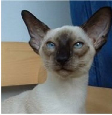
Modern Siyam Kedisi