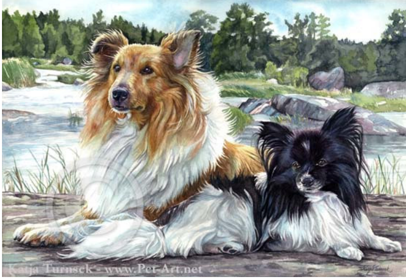
Sheltie & Papillon